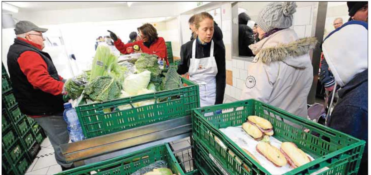
Hilfe für Bedürftige: In Tafel-Läden verteilen Ehrenamtliche bundesweit gespendete Lebensmittel an Menschen mit geringem Einkommen. Seit 1995 ist die Essener Tafel aktiv. Dort arbeiten derzeit etwa 120 Helfer. Wöchentlich werden so rund 6000 Bürger direkt versorgt, weitere 10 000 erreicht die Essener Tafel mit der Belieferung von karitativen Einrichtungen.

Das wichtigste wäre, die Regelsätze für Hartz IV, die Altersgrundsicherung und im Asylbewerberleistungsgesetz so zu erhöhen, dass die Menschen wieder eine Chance haben, davon vernünftig leben zu können. Wir fordern: Für alle Altersgruppen sofort 30 Prozent mehr Geld! An den Armen wurde gespart, die Hilfen auf lächerliche Beträge zusammengestrichen. Ob für Hygieneartikel für Säuglinge, Bildungsangebote für Erwachsene oder Essen für kleine Kinder – das Geld reicht hinten und vorne nicht. Die Sätze sind veraltet und eher erraten als berechnet. Deshalb fordern wir eine unabhängige Kommission, die der Frage nachgeht: Was brauchen die Menschen wirklich? Diese Frage ist bislang konsequent ignoriert worden.